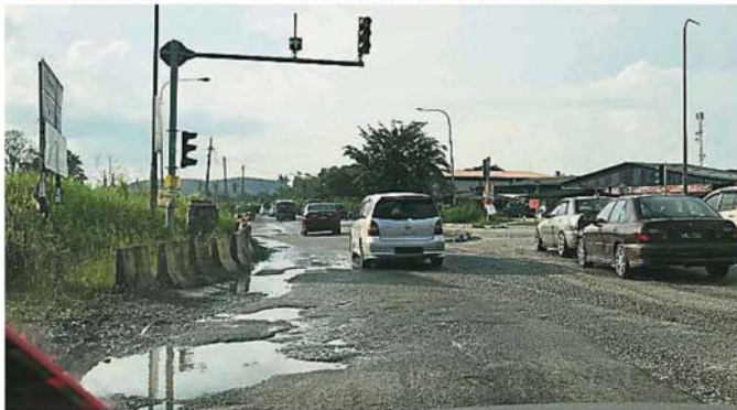
菁乡岭主要出入口的马路因为破损而长期积水，经常有摩多车骑士因为不察而撞入路洞受伤。

此前，由于B27州际公路的扩建工程一再因为承包商落跑而延误，再加上大雨和洪水的冲击，从万撓水旺广场前的古德士油站直至绍嘉娜花园入口处，长达约3公里的路面处处破裂，崩出数之不尽的大