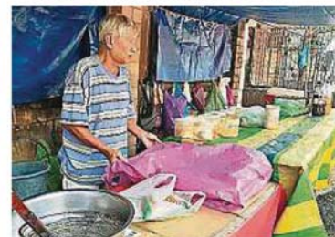
路边小販也吐苦水。