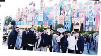
→ 《砂拉越报告》在脸书上载阿兹敏阿里 (左 6) 与家庭成员和随从，在日本欢乐度假的照片。