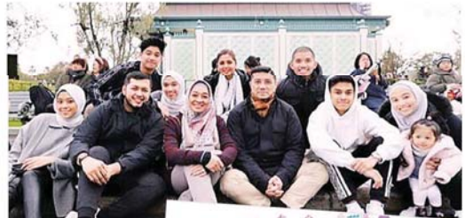
↑ 阿兹敏阿里 (前排左 4) 与家人及随从，开心合影。

《砂拉越报告》指出，他们是在 12 月 21 日飞离吉隆坡。《砂拉越报告》在其脸书上披露，有关事情可从这些“幸运的旅行者”于社交媒体上传的照片，而获得证实。贴文指，他们在社交媒体上，上传了与家庭成员在日本欢乐度假的照片。《砂拉越报告》还获悉，随着这个年末的日本之旅后，另有 12 个来回伦敦的商务舱已经被订购，乘客者仍是来自一样的家庭成员。“我们获悉，有关家庭成员会一直逗留至 2020 年 1 月的第一周。”贴文续指，预计这一次的行程，仅是机票所需的费用就高达 50 万令吉。#