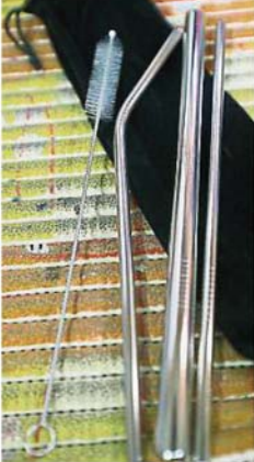
商家转卖可重复使用的不锈钢吸管，而且一套含有刷子与3种类型的吸管，方便消费者带出门使用。