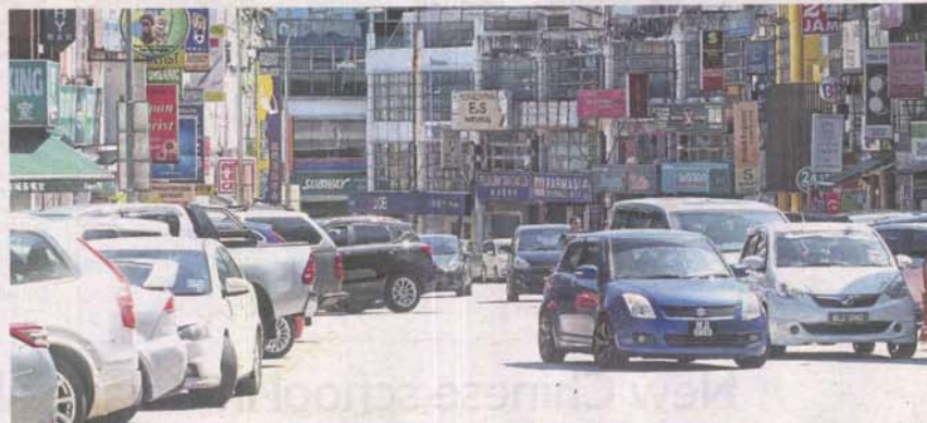
Taipan in Subang Jaya is an exemplary case for Petaling Jaya City Council, which is mulling the possibility of imposing one-hour limit on parking at its busy New Town commercial area.

"It is a good place for a new testing ground and if the feedback is