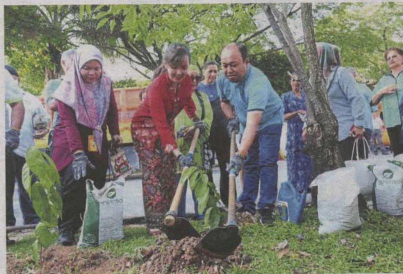
Ng (in red top), MPSJ officials, residents and representatives from various corporations planting trees in USJ 2.

The trees were planted under MPSJ's tree-planting programme to