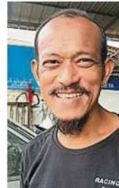
登姑阿尼斯：路面沙塵滾滾對民眾不健康。