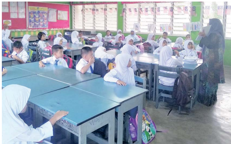
Murid Tahun Satu di SK Shah Alam memulakan sesi persekolahan semalam.

SHAH ALAM - Seramai 94,244 murid Tahun Satu membabitkan 633 sekolah di seluruh Selangor memulakan sesi persekolahan bagi tahun 2020 semalam.