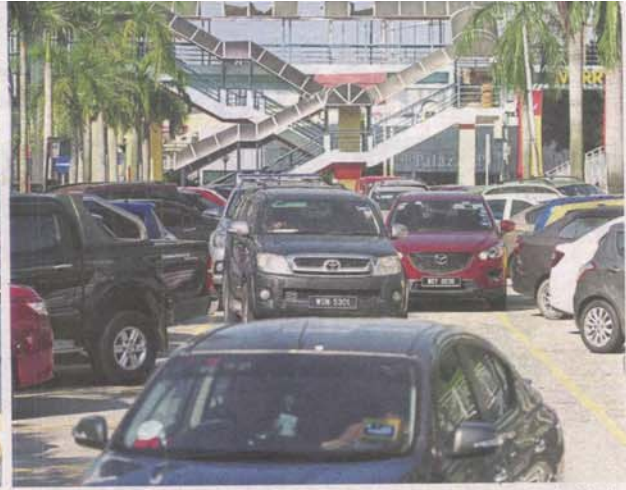
Some residents say those with monthly passes should use the carpark complexes instead of taking up street-side parking bays. (Right) Jalan 52/2, Petaling Jaya New Town, is chock-a-block with cars as all parking bays are filled up and visitors on an errand often double-park in desperation.

By SHEILA SRI PRIYA, HANIS SOFEA ZULKIFLI and KALAIVANI MURUGASAN metro@thestar.com.my