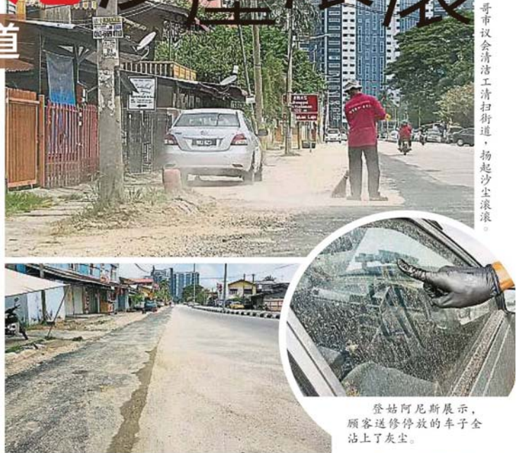
地下水管完成更新后却留下一地沙子。