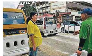
路上沙塵滿滿，學巴司機為之懊惱。