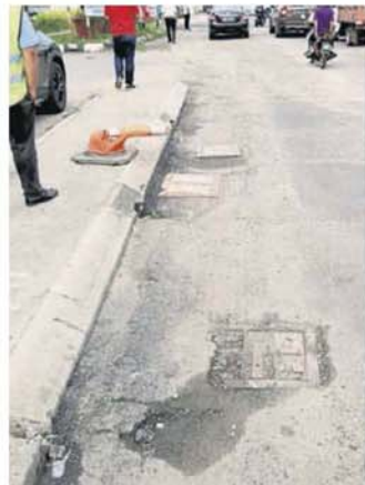
■旧商业区一带的地下水管一再破裂，生水因此溢出马路。

阿兹米占指出，巴生港口路的大路由工程局负责，内路则由市议会负责，导致两者在协调上出现失误，因此积水问题更加严重。 他说，市议会可以直接重铺道路，但是工局则必须把旧路挖深5公分再重铺，结果导致内路的水平线高过大路，一旦下雨或水管破裂，积水便会流向大路，导致大道因此一再积水损坏。 “我会向工程局反映此事，希望可以增高大路路面11公分，避免积水逆流的问题，同时必须与市议会协调，确保道路工程完善。” 他指出，今年财政部拨款5000万令吉提升港口区道路，他必须确保这笔拨款物尽其用，避免浪费纳税钱。 他说，当地地下水管是于60年代或70年代建设，已经逾半世纪，因此质量不符时宜，尤其该路经常有重型罗厘出入，造成道路挤压和晃动，令到地下水管容易被破坏。