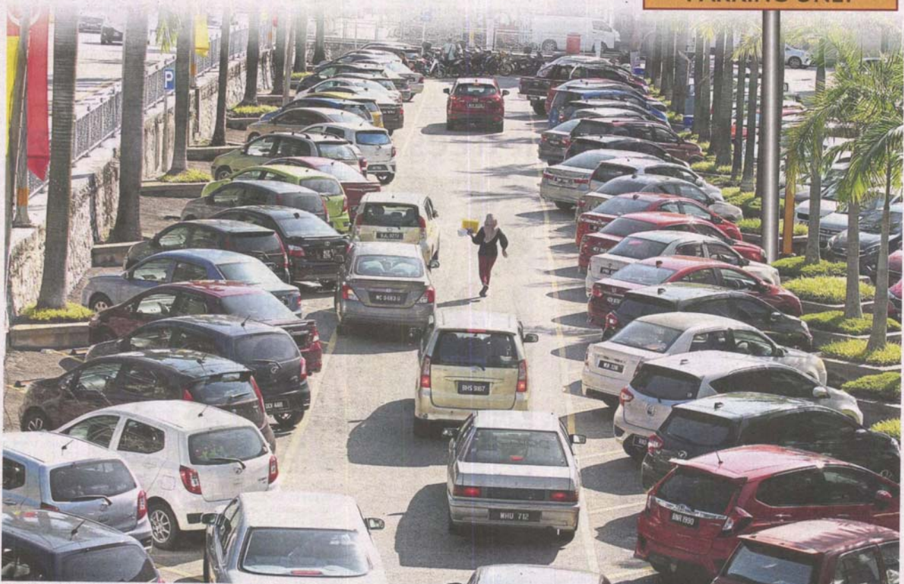
Parking nightmare: Most of the 150 public parking bays in Petaling Jaya New Town are occupied by office workers and employees of shops in the area, forcing visitors on errands to double park.