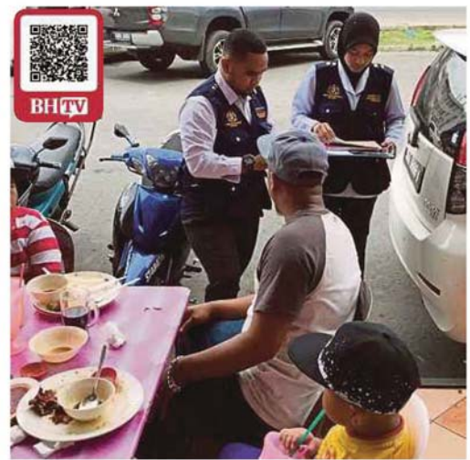
Anggota penguat kuasa Pejabat Kesihatan Persekutuan Tawau memeriksa premis makanan menerusi operasi khas, semalam.

Pengerusi Jawatankuasa Kesihatan, Alam Sekitar, Koperasi dan Kepenggunaan negeri, S Veera-