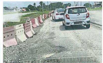
经过连日大雨的冲击，马路上出现无数大小坑洞。