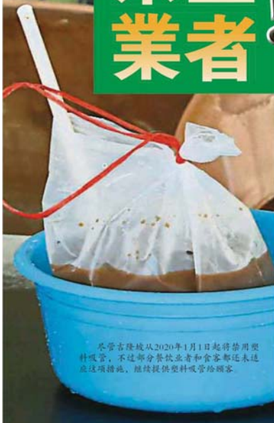
尽管吉隆坡从2020年1月1日起得禁用塑料吸管，不过部分餐饮业者和食客都还未适应这项措施，继续提供塑料吸管给顾客。

（吉隆坡2日讯）联邦直辖区从今年1月1日开始执行禁用塑料吸管政策后，尽管吉隆坡市民早已准备就绪，但还是有些茶室业者如常主动提供塑料吸管，似乎还没做好迎接这项减塑措施的准备！